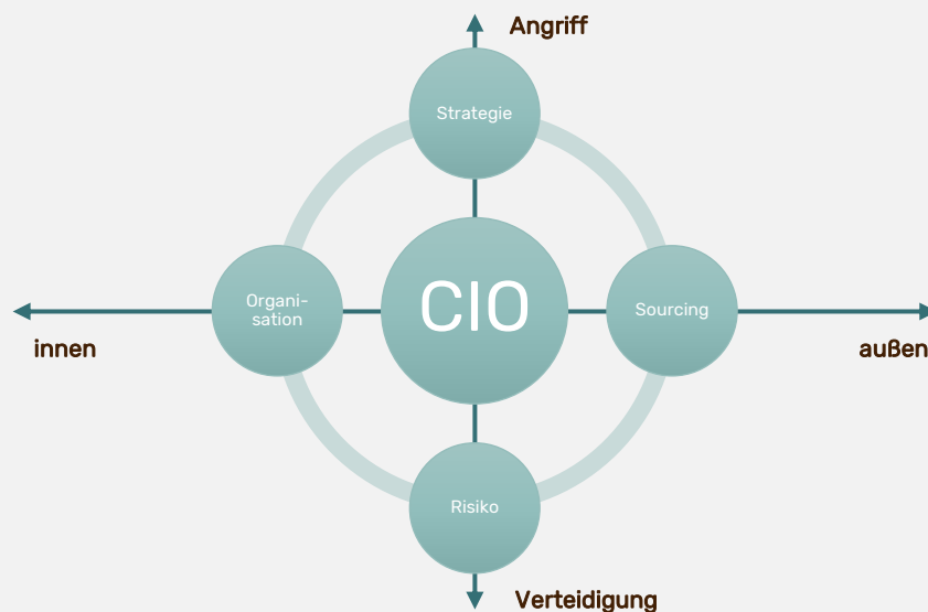
Abb. 1: Die vier strategischen Gestaltungsfelder des CIOs

Die „unlösbare Aufgabe“ beruht auf der Beherrschung von vier Gestaltungsfeldern: Strategie, Sourcing, Organisation und Risiko. Nichts Neues aus Sicht eines CIOs. Die Herausforderung liegt jedoch darin anzuerkennen, dass sich diese vier Felder enorm verändert haben und enger denn je verschränkt sind.